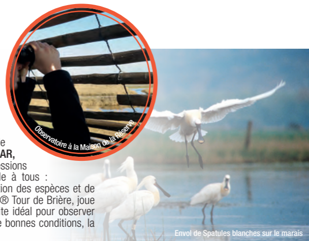
Envol de Spatules blanches sur le marais

Pour préserver les qualités paysagères et naturelles du marais, une véritable pléiade de systèmes de protections, classements et labels, a été mise en place : site classé, site RAMSAR , Parc naturel régional , Natura 2000 , Réserve naturelle... autant de boucliers contre les agressions dont le milieu pourrait être victime. Parmi toutes ces protections, il en est une qui parle à tous : « Réserve naturelle régionale ». Elle s'applique à trois secteurs importants pour la protection des espèces et de leurs habitats. L'un d'entre eux, celui de Rozé, à Saint-Malo-de-Guersac, desservi par le GRP® Tour de Brière, joue le rôle de « vitrine de la biodiversité », en y associant la préservation et l'accessibilité. Le site idéal pour observer la nature sauvage, mais point trop à l'état brut non plus : un « plus » pour découvrir dans de bonnes conditions, la Spatule blanche ou la Gorgebleue à miroir blanc de Nantes qui passeraient à côté.