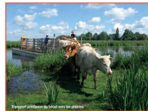
Transport printanier du bétail vers les prairies

• L'élevage bovin briéron s'exerce au cœur du marais. Au printemps, les bêtes sont conduites en barge sur des prairies qui demeurent inondées en hiver. En broutant, elles participent au maintien des paysages, et à la richesse faunistique et floristique de ces milieux. Bien qu'abandonné au cours du XX e siècle, l'élevage extensif en marais connaît un nouvel essor. Une marque « Parc naturel régional de Brière » a même été créée pour promouvoir la viande produite. Le GRP® Tour de Brière emprunte, notamment sur le secteur de Saint-André-des-Eaux, de Trignac et de La Chapelle-des-Marais, ces prairies humides : attendez-vous à partager le sentier avec le bétail, paisible et habitué au contact de l'Homme. Des barrières limitent la liberté relative des troupeaux : les agriculteurs investis dans ce renouvellement de l'élevage, comptent sur vous pour les refermer derrière vous.