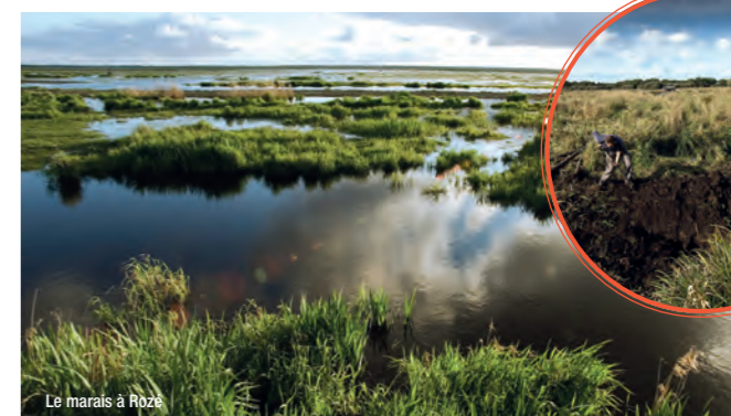
Le marais à Rozé