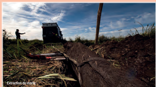
Extraction du morta

4000 ans plus tard, ce bois noir, en cours de fossilisation, est encore bien présent dans le sol du marais et visible pour le randonneur attentif. Il est appelé « morta ». Autrefois utilisé en charpenterie pour ses qualités imputrescibles, il trouve aujourd'hui sa place dans l'artisanat d'art.