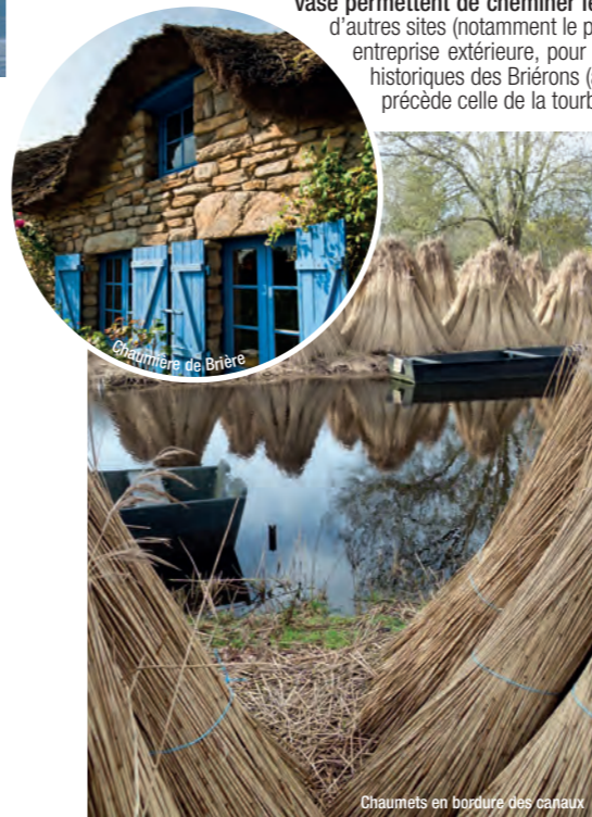
Chaumets en bordure des canaux