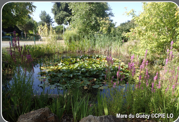
Mare du Guézy

Approchez-vous un peu pour observer la mare... C'est une zone tampon entre certains éléments qu'elle peut stocker et épurer, avant que le milieu ne les absorbe. À votre avis, d'où vient l'eau qui l'alimente ? Observez bien la variété de toutes ses espèces végétales aquatiques. Y entendez-vous la grenouille, voyez-vous passer une libellule ? Ou serait-ce plutôt une demoiselle... ? Mais au fait, connaissez-vous la différence entre les deux ?