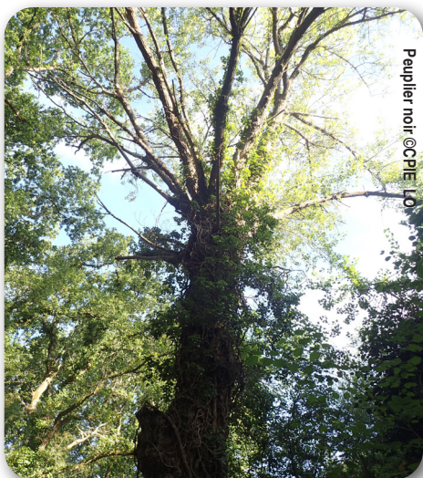
Peuplier noir

→ Continuez sur tout droit puis tournez sur l'avenue des Colombes.