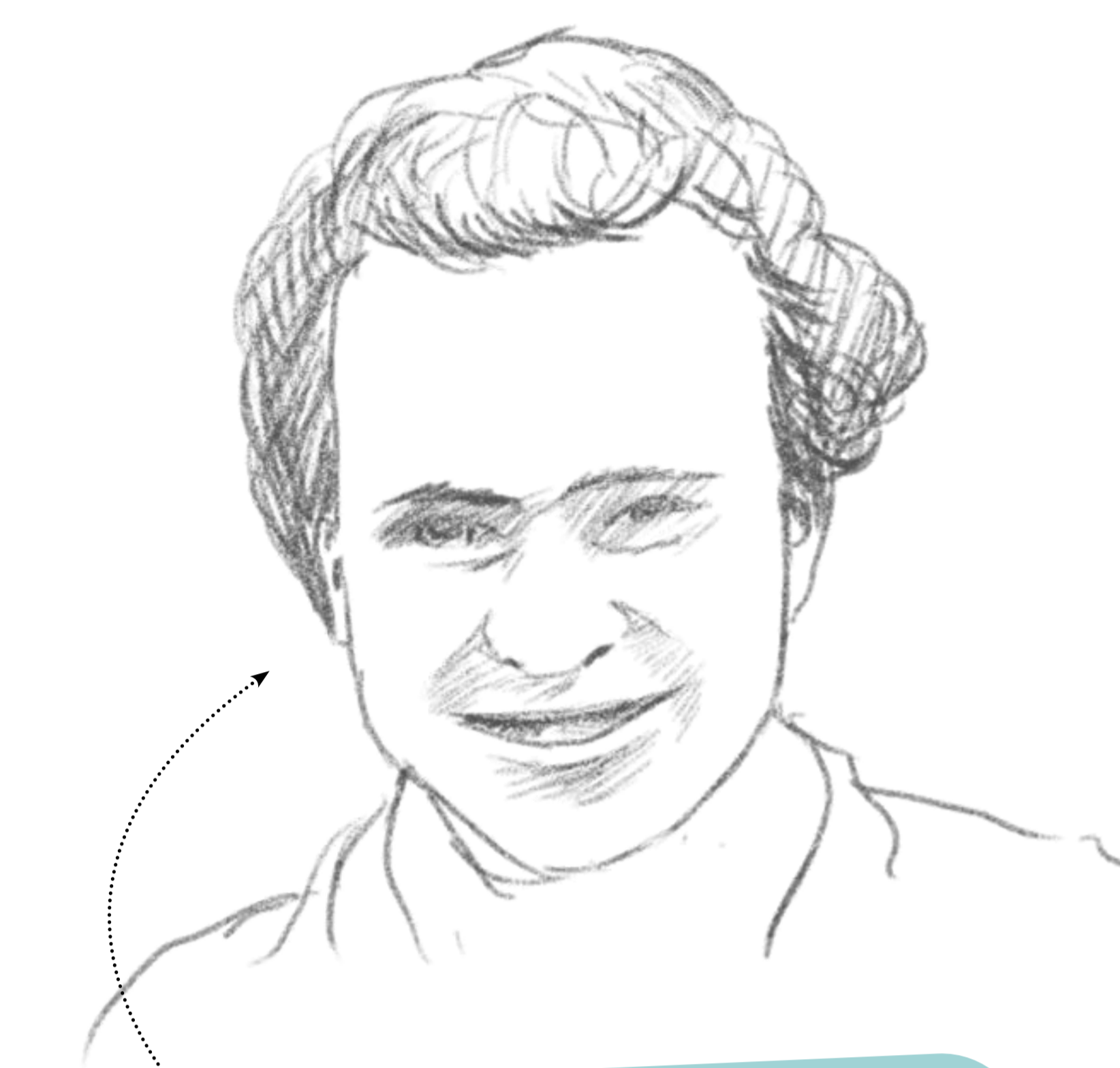
RENÉ GUY CADOU