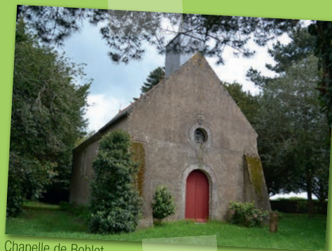
Chapelle de Bohlet

Respectons les espaces naturels et protégés Restons sur les sentiers balisés Ne laissons ni trace de notre passage, ni déchets Respectons la flore Respectons la faune sauvage et la tranquillité des troupeaux Respectons le code de la route Gardons les chiens en laisse Refermons les clôtures et les barrières