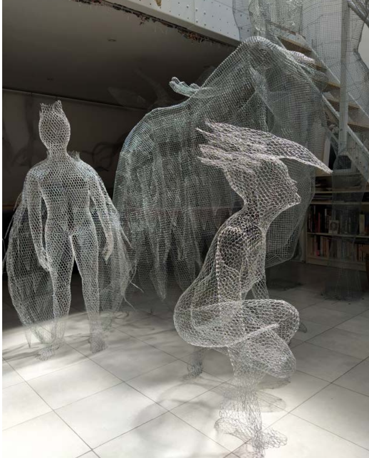
Juillet 2022 - Château de Ranrouët

www.sculpture-danielacapaccioli.com www.instagram.com/danielacapaccioli/?hl=it www.facebook.com/daniela.capaccioli/ www.youtube.com/watch?v=qQ5t_Twu06Q&t=12s