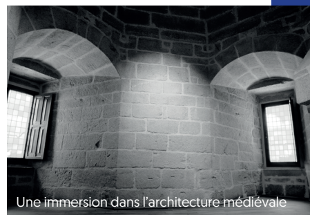
Une immersion dans l'architecture médiévale

Sur ces 3 niveaux, vous explorerez la chambre de herse, la salle d'honneur devenue l'ancienne salle du conseil municipal, ou, à l'occasion d'une visite guidée, les combles avec sa charpente du 17 e siècle. Vous découvrirez alors les seuls intérieurs de l'enceinte médiévale ouverts à la visite.