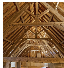
Une charpente du 17 e siècle à couper le souffle