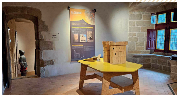
Des espaces de visite riches en manipulations ludiques ou interactives

You will visit on the 3 floors the portcullis room, the hall of honour which became then the boardroom and finally the 17th century framework in the attic exclusively accompanied with a guide.