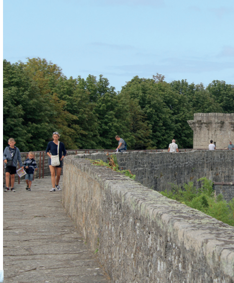
Un chemin de ronde ouvert sur 485 m de long

Avec ses 1 300 mètres de remparts, l'enceinte urbaine de Guérande est l'une des mieux conservées de France. Elle a su préserver son intégralité et son authenticité sans aucune reconstruction. Si une partie du chemin de ronde a disparu avec le temps, plus d'un tiers est accessible à la visite depuis la Porte Saint-Michel. Vous y découvrirez les systèmes de défense, vous entrez dans la Tour Sainte-Anne et vous surplomberez les douves au niveau de la porte Vannetaise.