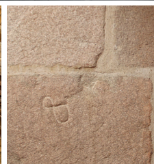
Des murs chargés d'histoire

As the main entrance of the medieval town, the porte Saint-Michel was both a defensive fortification and the place where the town captain used to live. Filled with more than 6 centuries of history, it was first a dwelling in the time of the Dukes of Brittany, then a prison at the French Revolution, a town hall from 1815 to 1954 and finally a museum from 1928. As it was registered historical monument in 1889, it still embodies the town prestige and power in the Middle Ages.